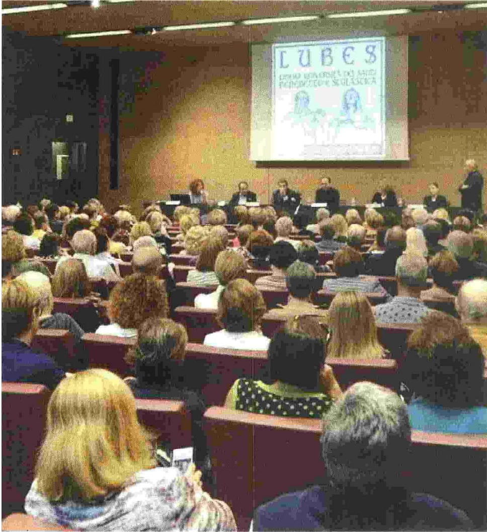
Partecipazione. La Lubes ha quattro sedi: Leno, Asola, Milzano e Casalmaggiore

Ritaglio stampa ad uso esclusivo del destinatario, non riproducibile.