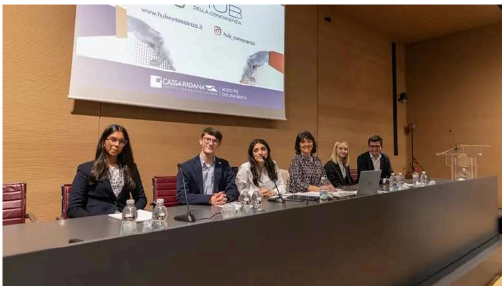
I giovani intervenuti