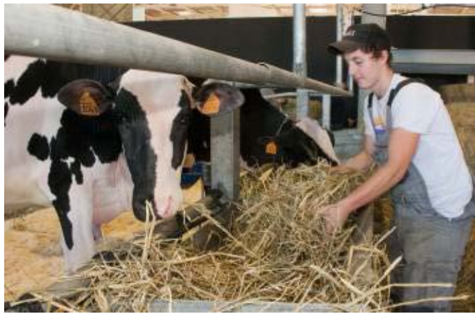
Una foto scattata in una recente edizione delle Fiere Zootecniche

CREMONA Continuano con il vento in poppa gli impegni di CremonaFiere che proprio in questi giorni sta completando il programma convegni di Fiere Zootecniche Internazionali, che vedrà lo svolgimento della edizione 2024 - la 79ª - dal 28 al 30 novembre 2024 ( www.fierezootecnichecr.it ). Tra i temi al centro dei dibattiti anche la comunicazione verso il consumatore con i convegni 'Milk.it' e 'Meat.it', appuntamenti ormai consolidati nell'ambito del ricchissimo programma convegni.